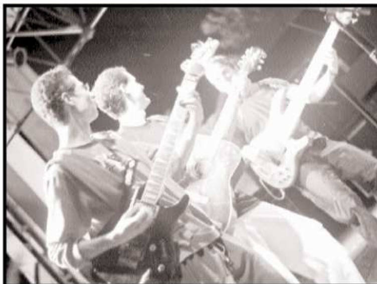
Para a Banda Dominus, mais importante que fama, sucesso e dinheiro é transmitir a palavra de Deus através da música

E não importa o ritmo. O que as bandas querem é transmitir a palavra de Deus de uma forma descontraí-